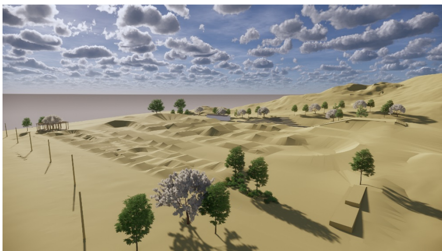
3D-illustration av BMX-bana och pumptrack

Fastighetskontoret Fastighetsavdelningen