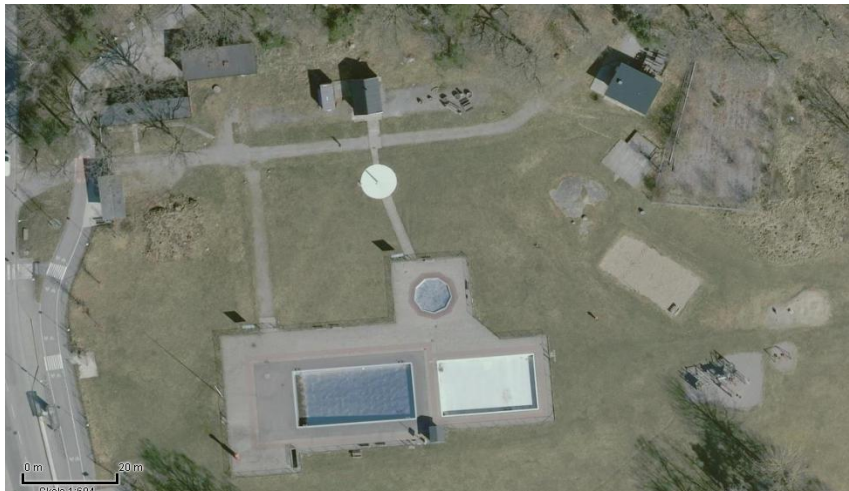
Flygfoto över Älvsjöbadet