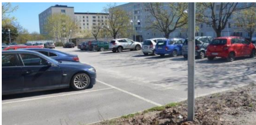
Parkeringsyta i Nybohov där dagvatten bör renas innan avledning.