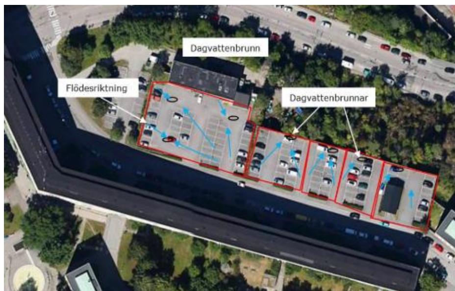
Figur 2. Parkeringsyta vid Nybohovsgränd, figur från WRS (2017)