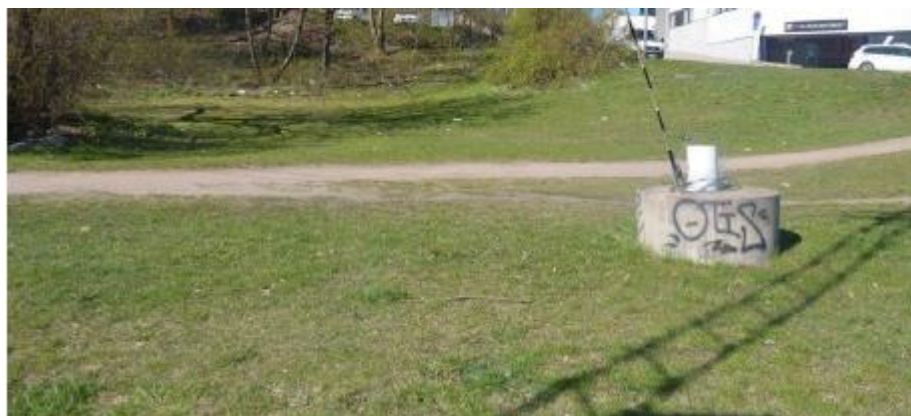
Platsen för föreslagen torrdamm.