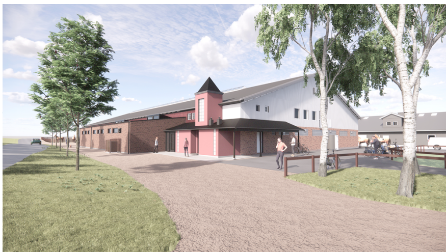
Illustration, tillbyggnad i tegel till vänster på bilden.

En viss mindre markplanering runt tillbyggnaden planeras för att klara dagvattenhanteringen och tillgängligheten.