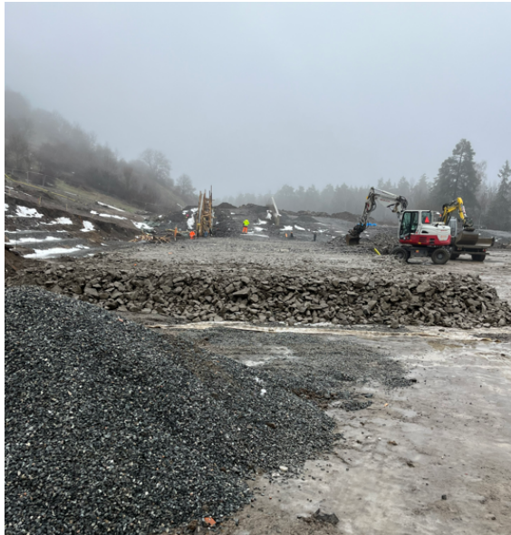
Bild 3 Uppbyggnad BMX-banan, startkulle och läktare