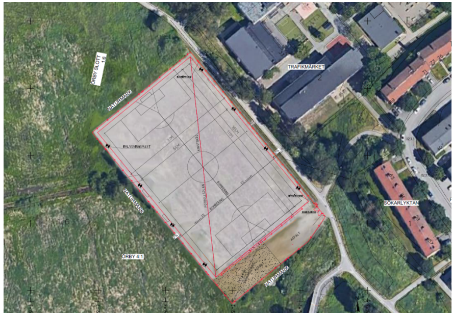
Situationsplan av föreslagen utveckling av Sjöängens BP med 11-spelsplan, stängsel, belysning och upplagsyta för snö.

Förvaltningarna avser att anlägga en fullstor konstgräsplan för 11-spel, som kan anpassas för 9- och 7-spel, planbelysning och nytt bollstängsel, där uppförande av panelstängsel och nät förordas. Bollplanen föreslås anläggas med ett spelmått och totalmått enligt de senaste riktlinjerna från fotbollsförbundet.