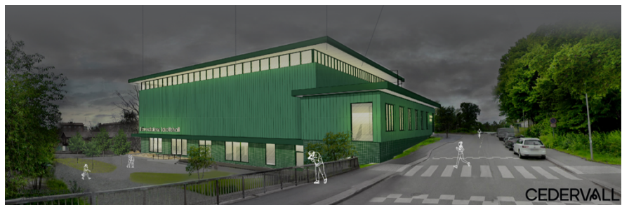
Illustrationer över den planerade idrottshallen. Överst syns hallen från parken i öster. Nederst syns hallen västerut från Bjursätragatan.

Idrottshallen innehåller två våningar som kopplas samman med trappor samt hiss. Den övre våningen nås via huvudentré från Bjursätragatan/Bäverdammsgränd. På övre plan finns idrottshallen med tillhörande läktare och förråd.