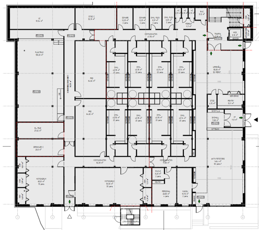
Programhandlingens planlösning nedre plan, entré via parken öster om byggnaden.