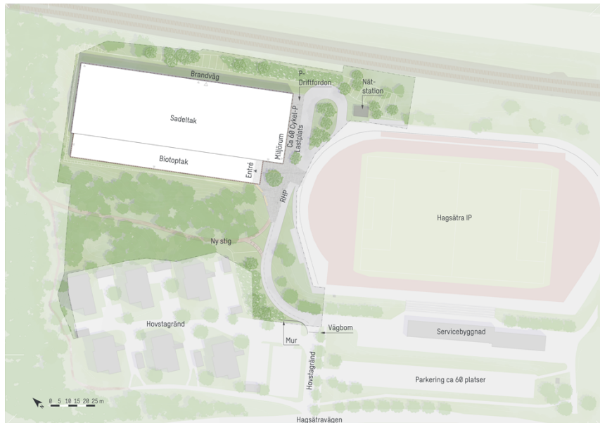
Föreslagen placering av den nya idrottsanläggningen.