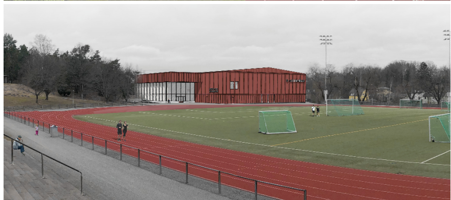
Illustration av framtida Hagsätra is- och idrottshall.

Fastighetskontoret Fastighetsavdelningen