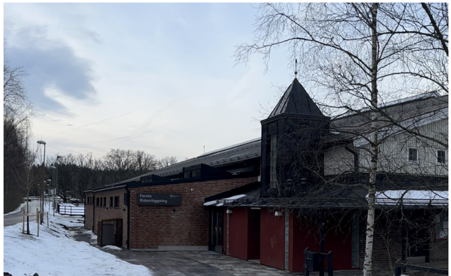
Tillbyggnaden sedd från parkeringen.

För att möta verksamhetens behov har en omklädningsbyggnad i anslutning till det gamla ridhusets södra sida uppförts.