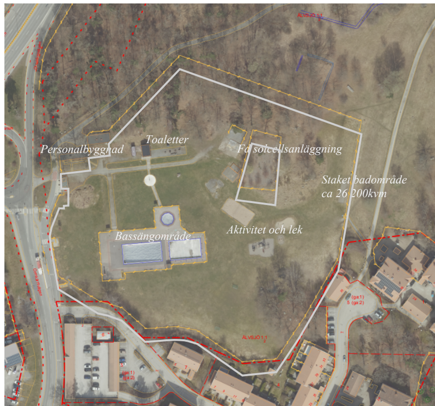
Flygfoto över Älvsjöbadet, utbredning samt befintlig anläggning.

Genomförandebeslut fattades av fastighetsnämnden (dnr FSK 2021/409) och idrottsnämnden (dnr IDN 5.1.1/2021/2307) i april 2022. Kommunfullmäktige fattade genomförandebeslut den 13 juni 2022.