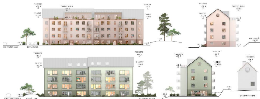
Figur 2 – De två nya bostadshusen från olika vinklar. Illustration av Dinell Johansson, källa stadsbyggnadskontoret.

Planen innefattar ingen allmän platsmark och innebär därför ingen förändring på park, naturmark, gata eller torg. Planens storlek innebär också att det inte är aktuellt med en förskola i planen. Stadsdelsförvaltningen har ett pågående samarbete med SISAB, stadsbyggnadskontoret och exploateringskontoret för att se över helheten vad gäller förskolebehovet i Aspudden.