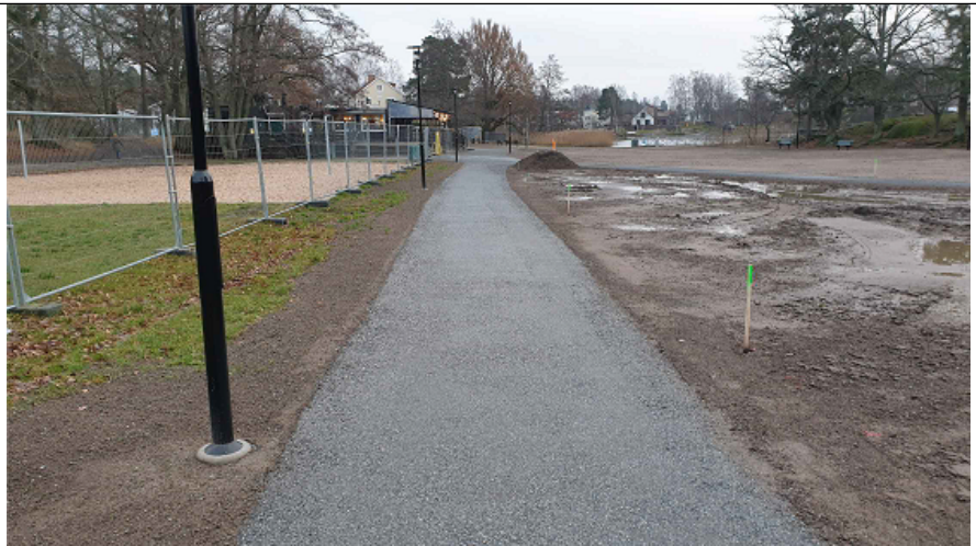
Ny belysning utmed parkvägen vid badet.