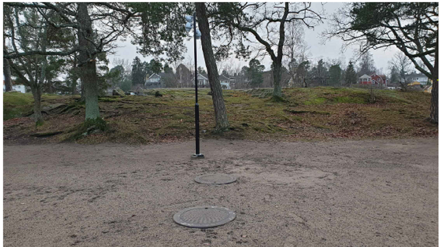
Ny punktbelysning riktad mot träden.