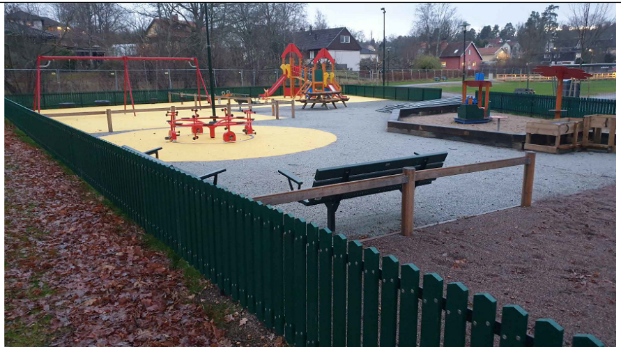
Lekplatsen med belysningsmaster innan parken öppnades.