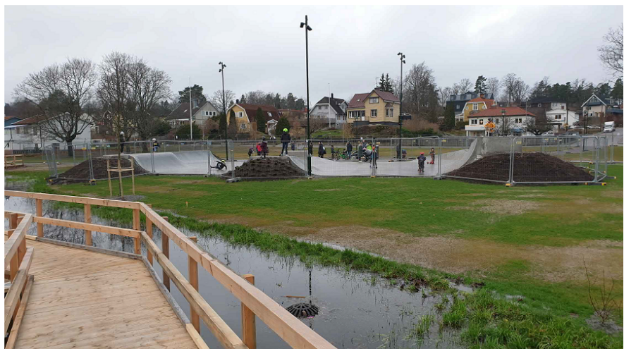
Efter skejtparkens öppning. Byggstaket kvar för att skydda gräsytor.