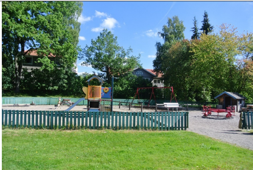
Lekplatsen före ombyggnad. Ingen belysning.