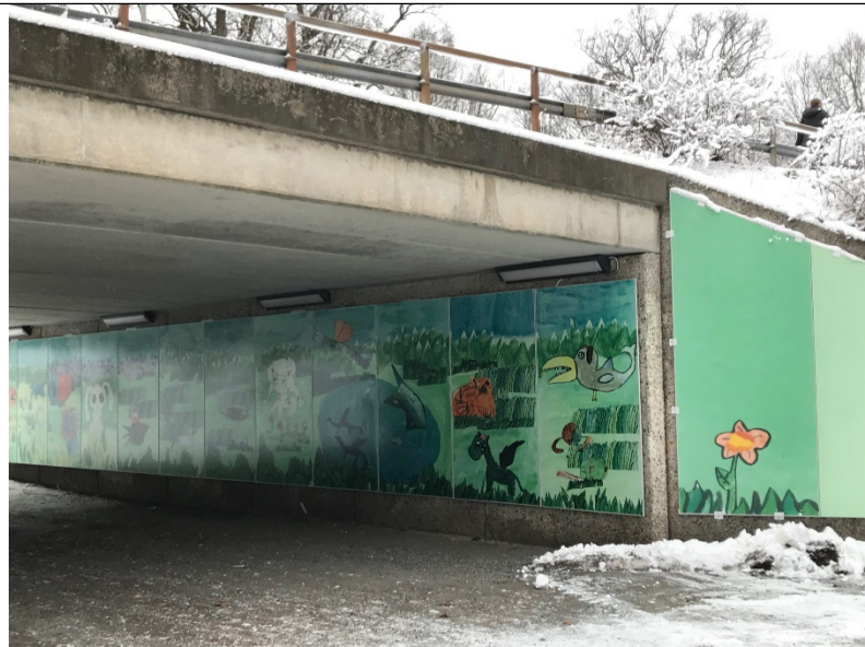
Tunneln mot Apelsinen, ena sidan med in- och utvändiga paneler.