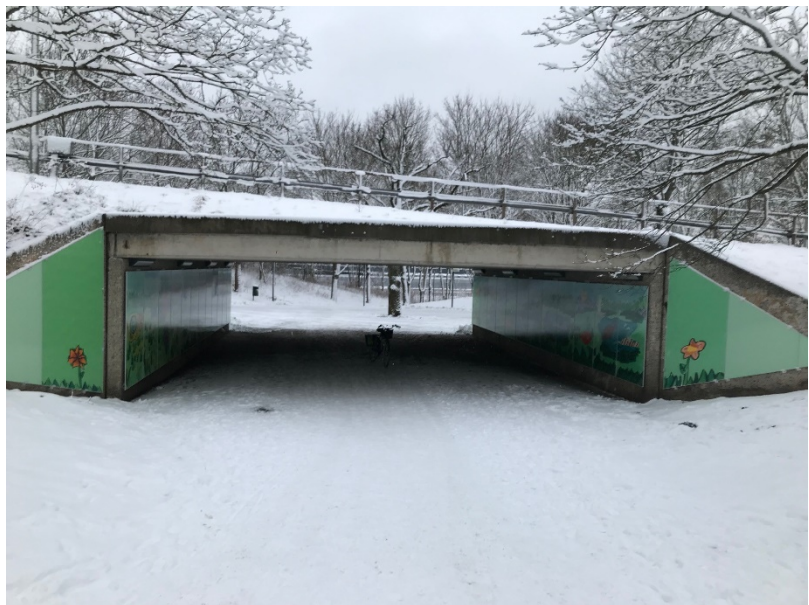
Tunneln mot Apelsinen, utvändiga paneler.