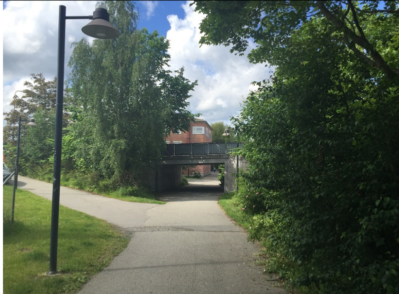
Smal gångtunnel från Solbrännan mot Prästgårdsgärde/ÄlvsjöC.