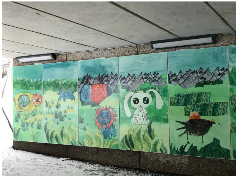
Tunneln mot Apelsinen, invändiga paneler.