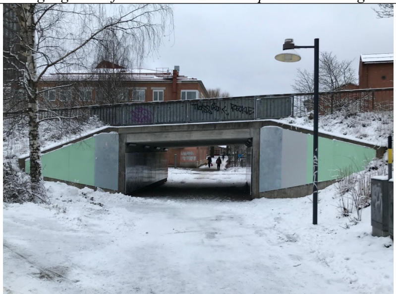
Tunneln mot Prästgårdsgärde, utvändiga paneler.