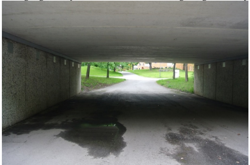
Bred gångtunnel från Solbrännan mot Apelsinen/Solberga.