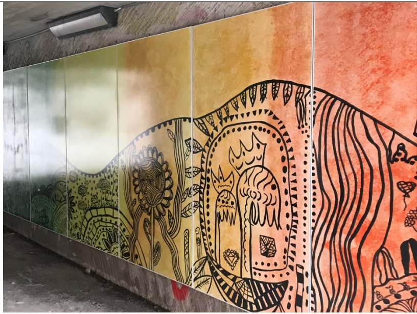
Tunneln mot Prästgårdsgärde, invändiga paneler.