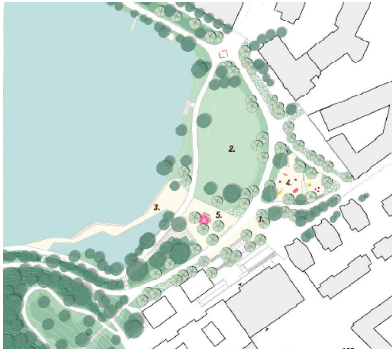
Figur 6 Förslag på parkens framtida utformning. Bland annat föreslås stora träd rama in parken (1), fortsatt öppna gräsytor (2), en brygga/spång som kompletterar gångstråket (3), Fruktparken behållas men flyttas något (4), caféverksamhet finns kvar i parken om än på en ny plats (5). Källa Landskapslaget

Viss parkmark kommer att tas i anspråk i och med detaljplanens genomförande. Den överväldigande delen av Trekantsparken och Fruktparken ingår inte i planområdet och exploateringskontoret arbetar med ett förslag till omgestaltning av parken för att stärka de rekreativa värdena när antalet boende och besökare ökar. Se figur 6 med ett förslag på parkens framtida utformning.