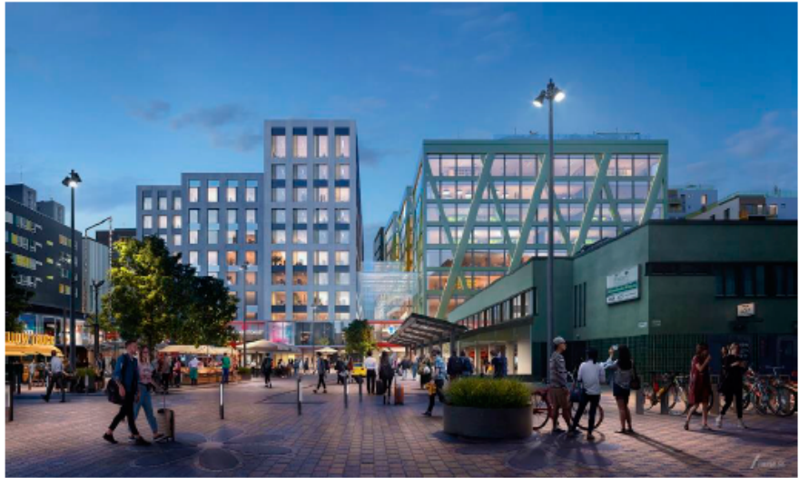
Figur 4 Visionsbild för Liljeholmstorget.

Planområdet är präglad av stora höjdskillnader. Från Liljeholmstorget ner till Trekantsparken finns en höjdskillnad på fem meter. Som ett sätt att koppla samman planområdet föreslås terrassplatsen anläggas för att överbrygga de topografiska skillnaderna. Terrassen kommer att möjliggöra en tillgänglig koppling mellan Trekantsparken och torget, se figur 5. I dagsläget består kopplingen av en trappa och en hiss. Kopplingen kommer bestå av en ramp med lutning för att klara tillgänglighetskraven, samt trappor. Rampen ska också kunna användas av fordon i låg hastighet för att möjliggöra angöring till bostadshusen. Terrassen är också en plats för rekreation med sittplatser i bra solläge och vy ut mot parken och sjön.