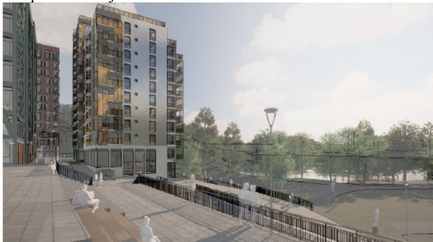
Figur 5 En illustreringsbild från nya Liljeholmsgränd. Gränden syns till vänster i bild mellan det nya bostadshuset och gallerian. Mitt i bilden är den nya terrassen som vetter ut mot trekantsparken och sjön.

Planområdet är präglad av stora höjdskillnader. Från Liljeholmstorget ner till Trekantsparken finns en höjdskillnad på fem meter. Som ett sätt att koppla samman planområdet föreslås terrassplatsen anläggas för att överbrygga de topografiska skillnaderna. Terrassen kommer att möjliggöra en tillgänglig koppling mellan Trekantsparken och torget, se figur 5. I dagsläget består kopplingen av en trappa och en hiss. Kopplingen kommer bestå av en ramp med lutning för att klara tillgänglighetskraven, samt trappor. Rampen ska också kunna användas av fordon i låg hastighet för att möjliggöra angöring till bostadshusen. Terrassen är också en plats för rekreation med sittplatser i bra solläge och vy ut mot parken och sjön.