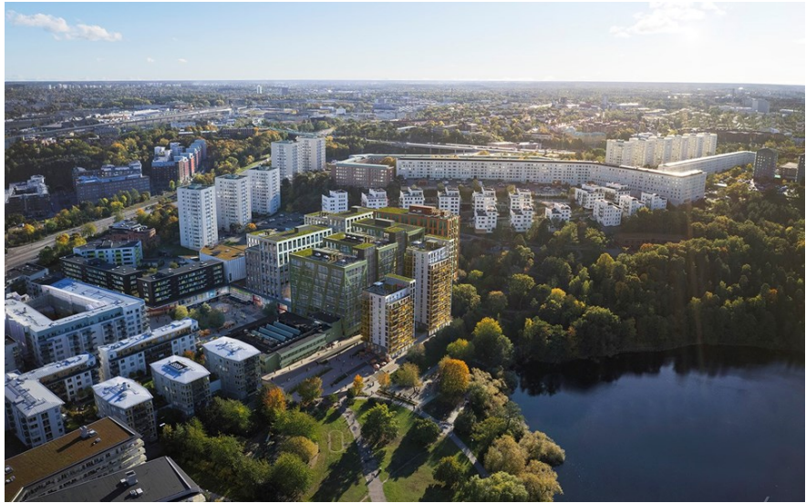
Figur 2 Illustration av planförslaget. Källa stadsbyggnadskontoret

Förskolan placeras i ett av kontorshusen, hus S mot Nybohovsbacken, på plan 3 och 4. Förskolegården anläggs på taket till ett befintligt hus.