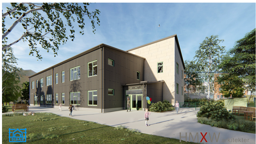
Illustration av förskolebyggnad.

Den nya förskolan planeras uppföras i två våningar i suterräng, med halvplansförskjutning. Förskolan uppförs som miljöbyggnad silver och alla material är kontrollerade mot byggvarubedömningen. SISAB ansvarar för rivning av befintlig förskola och stadsdelsnämnden för avetablering av befintlig paviljong. Förskolans kapacitet motsvarar 144 platser vilket ger en bruksarea om 10,1 kvm per barn.