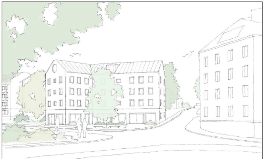
Figur 3 Illustrationsbild, korsningen Erik Segersälls väg och Blommensbergsvägen. Bilden visar bara föreslagna byggnadsvolymer. Fasadmateriell och färg visas inte.

Trots att exploateringen innebär en förtätning i området så lämnas parkmark mellan husen för att bibehålla en del grönska och luft, se figur 3 och 4. Det innebär dels att grönska bevaras, men också att området behålls förhållandevis öppet med remsor av allmän platsmark mellan husen. Detta för att bevara Aspuddens klassiska hus-i-park -stil. Husen placeras också för att specifikt skydda stora lövträd på platsen. Eftersom exploateringen ändå kommer att innebära att en del grönska avverkas kommer staden att göra ekologiska insatser i Aspuddsparken som kompensation.