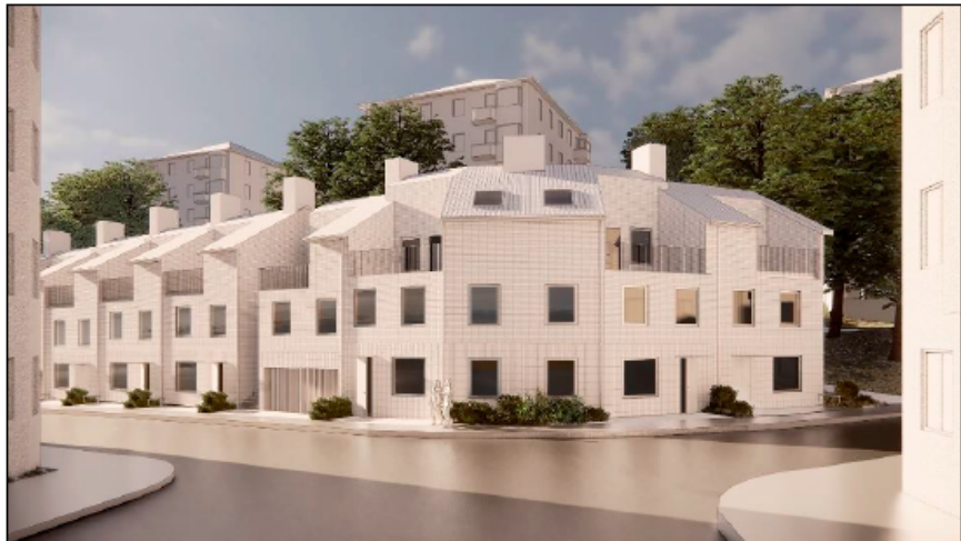
Figur 6 Illustration redovisande föreslagen utformning av nytt stadsradhus längs Hövdingagatan. I bilden redovisas endast föreslagna volymer, ej material och färgsättning. Vy från Manhemsgatan.

Blommensbergsvägen föreslås få en dubbelriktad cykelbana. Idag finns ingen cykelbana på platsen utan cyklar får dela plats med biltrafiken. Blommensbergsvägen föreslås också få en så kallad timlashållplats för bussar som en trafiksäkerhetsåtgärd.