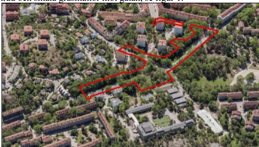
Figur 1 Planområdesgräns. Vy mot sydöst

Området är idag förhållandevis glesbyggt och luftigt med enstaka punkthus och villor. Planområdet har en relativt hög grönska med träd och smala gräsmattor mot gatan, se figur 1.