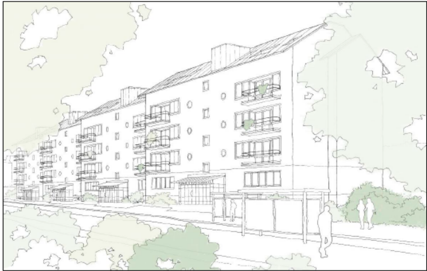
Figur 4 Illustrationsbild, längs med Blommensbergsvägen (delområde 4). Bilden visar bara föreslagna byggnadsvolymer. Fasadmaterial och färg visas inte.

Bostadshusen kommer ha entréplan mot allmän plats, men mötet mellan privat och offentligt ska utformas med stor omsorg. I samtliga av flerbostadshusen möjliggörs lokaler för centrumändamål i bottenvåning. Huset i delområde 3 har skall-krav på lokal för centrumändamål.