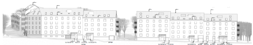
Figur 5 Illustration av delområde 1. Bilden visar bara föreslagna byggnadsvolymer. Fasadmaterial och färg visas inte. Bild: Arkitema, hämtad från SBK.

Bostadshusen kommer ha entréplan mot allmän plats, men mötet mellan privat och offentligt ska utformas med stor omsorg. I samtliga av flerbostadshusen möjliggörs lokaler för centrumändamål i bottenvåning. Huset i delområde 3 har skall-krav på lokal för centrumändamål.