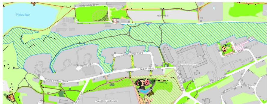
Hundrastområdet är markerat med blågröna streck.

Platserna 2-4 ingår dessutom i ett så kallat hundrastområde. Ett hundrastområde är ett rastområde som inte är inhägnat. Det är en öppen yta, där hundar får släppas lösa, under förutsättning att ägaren har hunden under uppsikt och att den kommer på inkalling. Både hundrastområden och hundrastgårdar regleras i stadens ordningsföreskrifter. Ett hundrastområde och en hundrastgård kan inte förekomma på samma plats.