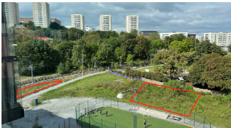
Fotografi med de två föreslagna platserna rödmarkerade.

Ett medborgarförslag inkom den 14 september 2021 med önskemål om att anlägga en hundrastgård vid Blomsterdalen i Årstadal. Medborgarförslaget innehåller förslag på två platser, dels längs med Tvärbanan och dels i slänten ner mot bollplanen. Önskemålet är att hundrastgården främst ska vara öppen för mindre hundar.