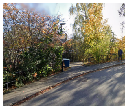
Trappan sedd från Mästarbacken.

Med ovanstående motivering föreslår förvaltningen att stadsdelsnämnden avslår medborgarförslaget om att anlägga en cykelramp mellan Mästarbacken och Läringsbacken.