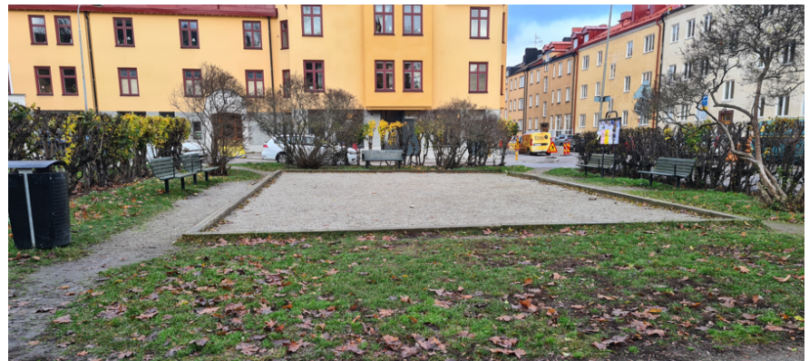
Boulebanan i Julikullen

○ = Julikullen; där det redan idag finns en boulebana.