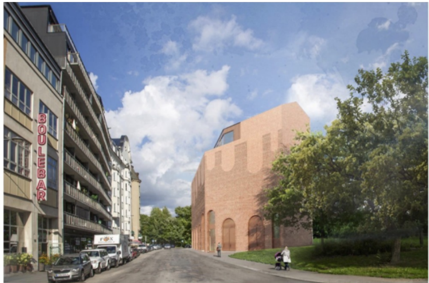
Planförslaget sett från Liljeholmsvägen, österut.