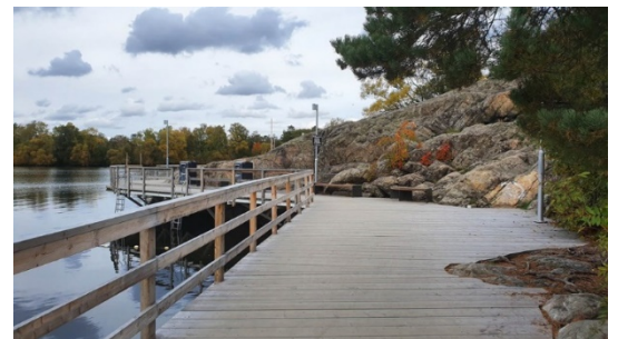
Örnbergs bryggbad är en officiell badplats i stadsdelsområdet.

Hägersten-Älvsjö stadsdelsnämnd överlämnade den 31 augusti 2023 ett medborgarförslag till förvaltningen för beredning. Medborgarförslaget innehåller önskemål om att anlägga fler badplatser i närområdet kring den officiella badplatsen vid Örnberg i Hägersten.