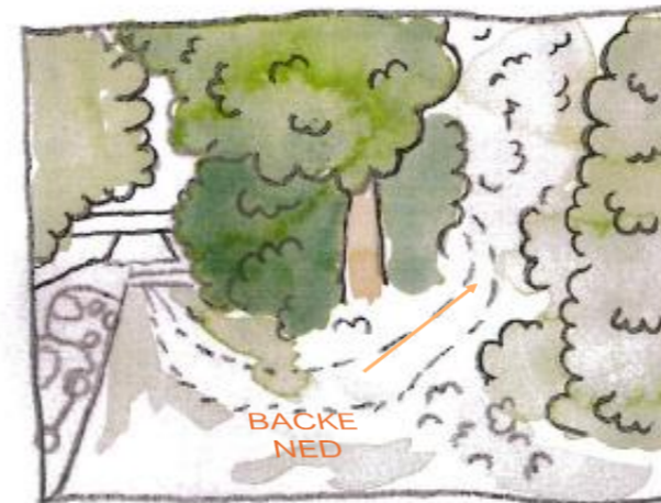
Vy C nytt utseende med föreslagen ramp inritad