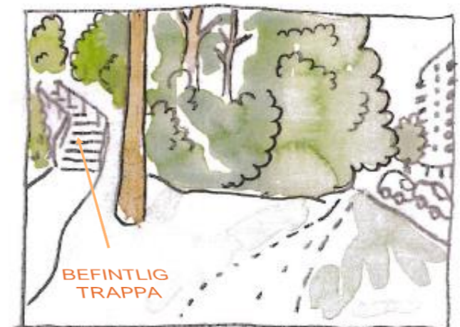
Vy D nytt utseende med föreslagen ramp inritad