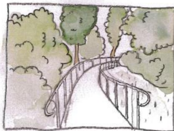
Vy B nytt utseende med föreslagen ramp inritad