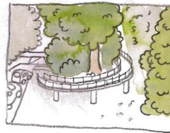
Vy C nytt utseende med föreslagen ramp inritad