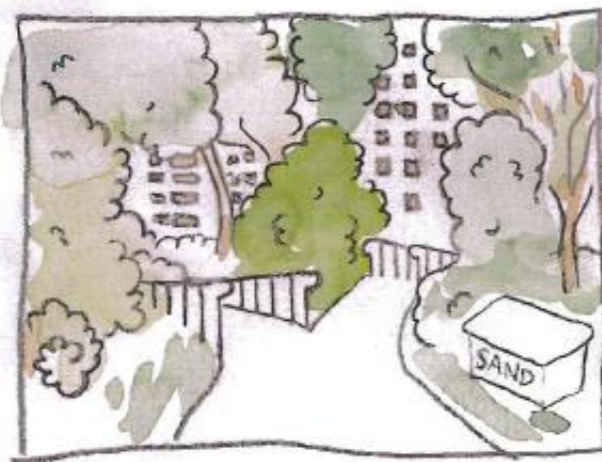
Vy A nytt utseende med föreslagen ramp inritad