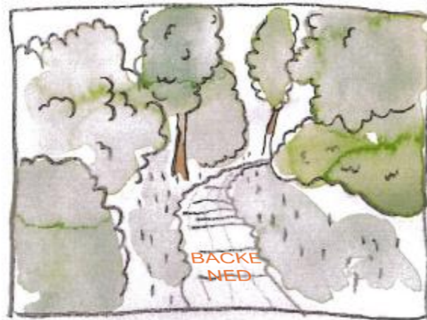
Vy B nytt utseende med föreslagen ramp inritad