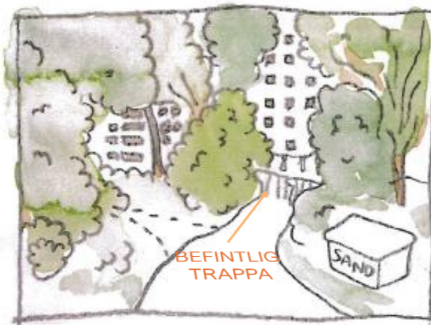
Vy A nytt utseende med föreslagen ramp inritad