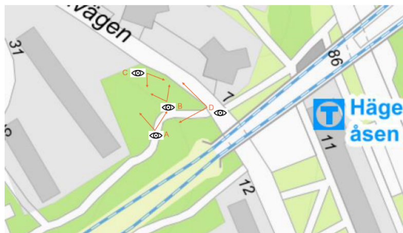
Situationsplan med förtydligande kring vart vyerna är tagna

Illustrationerna utgör en del av medborgarförslaget.