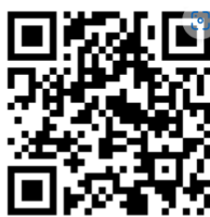
Exempel på en QR-kod som länkar till en webbplats.