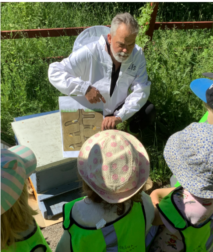
Biologisk mångfald vid förvaltningens förskolor under året.