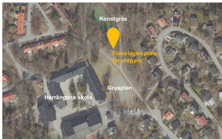
Föreslagen plats för utegym.

Hägersten-Älvsjö stadsdelsnämnd överlämnade den 26 september 2024 ett medborgarförslag till förvaltningen med önskemål om att anlägga ett utegym invid Herrängens skola. Förslagsställaren föreslår en plats strax söder om konstgräsplanen, men är även öppen för andra placeringar i närheten.