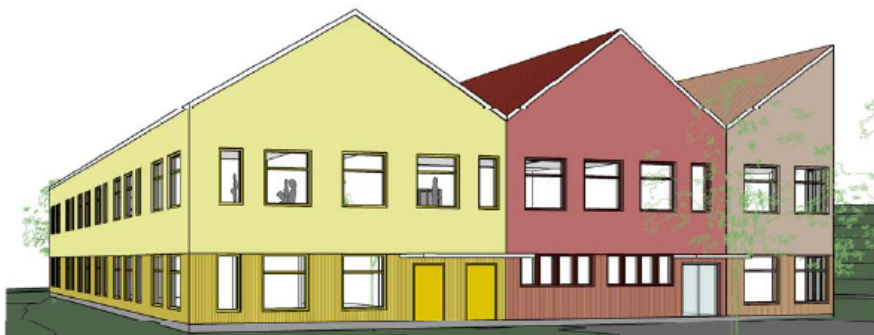
Vy från norr. Förskolans fasad mot angöringsväg. Gavelmotiv och färgsättning speglar arkitekturen i Västertorp. Cedervall arkitekter.