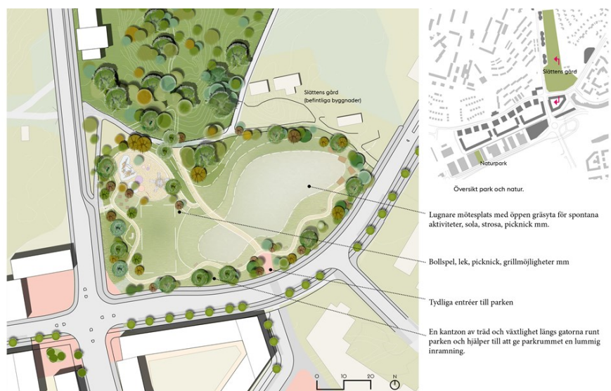
Illustration av ny utformning av Slättgårdsparken.

Slättgårdsparken är idag ett parkområde som är välbesökt, flera förskolor använder parken och anslutande naturmarksområde som utflyktsmål. I och med dess placering vid drivmedelsstationen och vägar med tung trafik blir bullernivån påtaglig. I förslaget till ny detaljplan är Slättgårdsparken en central allmän plats vars funktion blir att sammanfoga de två stadsdelarna Mälarhöjden och Bredäng. Parken föreslås få en ny gestaltning med blandade funktioner och ny växtlighet som bidrar till att minska bullernivåerna.