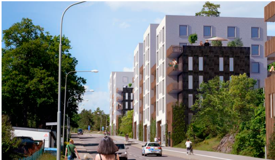
Konceptbild föreslagen bebyggelse längs Bredängsvägen. Illustration Varg arkitekter.