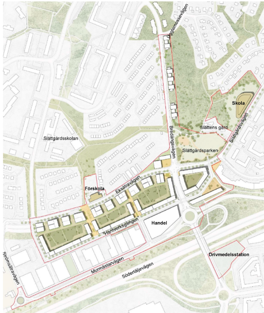
Illustrationsplan över planområde med anslutande delar. Illustration EGA/AIM

Platsen är idag starkt präglad av trafikplats Bredäng och föreslagen detaljplan ska bidra till en bättre ljudmiljö för de boende och besökare på platsen. Ytterligare ett syfte med detaljplanen är att bidra till långsiktig social hållbarhet genom att stärka anknypningen mellan de tre stadsdelarna.