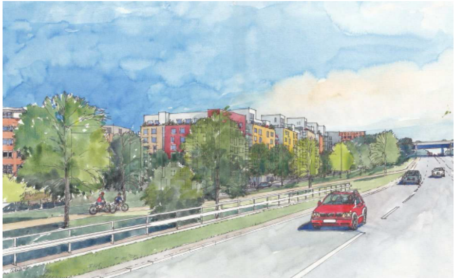
Perspektiv från Södertäljevägen och söderut.