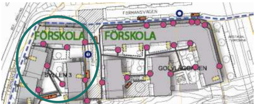
Till vänster på ovanstående bild syns var förskolan på Syllen 3 ska ligga. Förskolan Spåret till höger byggde Stockholmshem åt stadsdelsförvaltningen 2015.

Den planerade förskolan på 568 kvm har plats för tre barngrupper. Förskolans lokaler är förlagda i två plan ovanför källarplanet.