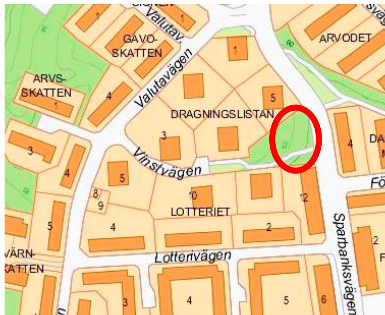
Planområdets placering vid Sparbanksvägen på Hägerstensåsen.

Detaljplanen syftar till att möjliggöra ett flerbostadshus med 45 bostäder, samtliga hyresrätter, på Hägerstensåsen.