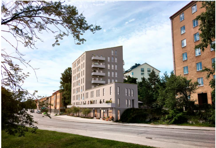
Illustration utmed Sparbanksvägen som visar den nya bebyggelsen. (Kod Arkitekter)

Detaljplanens genomförande innebär att parkmark går över till att bli kvartersmark med bostadsändamål. Den befintliga gångvägen mellan Vinstvägen och Sparbanksvägen får en något ändrad dragning söder om den nya byggnaden. På grund av höjdskillnaden på platsen är gångvägen inte fullt tillgänglig, varken i dagsläget i planförslaget.