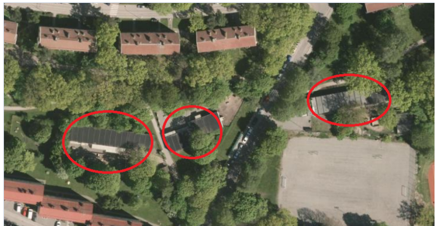
På ovanstående flygfoto är förskolepaviljongerna inringade med rött.

Stadsdelsförvaltningen har haft sammanlagt tre förskolepaviljonger med tidsbegränsade bygglov vid Stenkilsgatan. Två av dem har avetablerats medan en paviljong, norr om idrottsplanen, finns kvar. Under perioden 2017 till och med 2022 kommer det att byggas 780 lägenheter i Aspudden och antalet barn i förskoleålder väntas öka ifrån dagens 650 till 740 barn år 2022. Det föranleder ett behov av att bygga en ny permanent förskola i området.