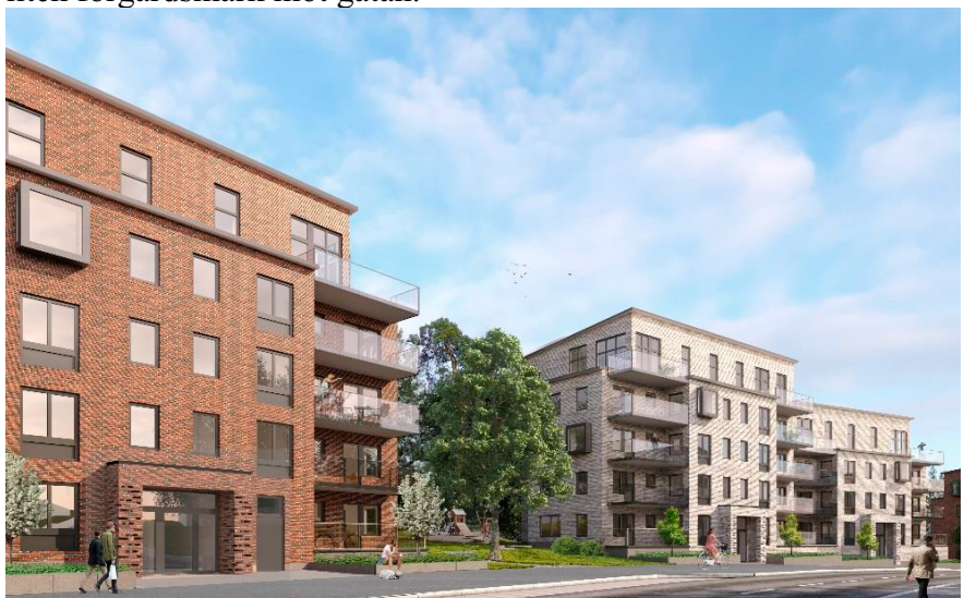
Bebyggelsen mot Bredängsvägen på den del som tillhör Hägersten-Liljeholmens stadsdelsområde. Illustration ÅWL arkitekter.

Husen placeras med huvudentréer och indragna balkonger och en liten förgårdsmark mot gatan.