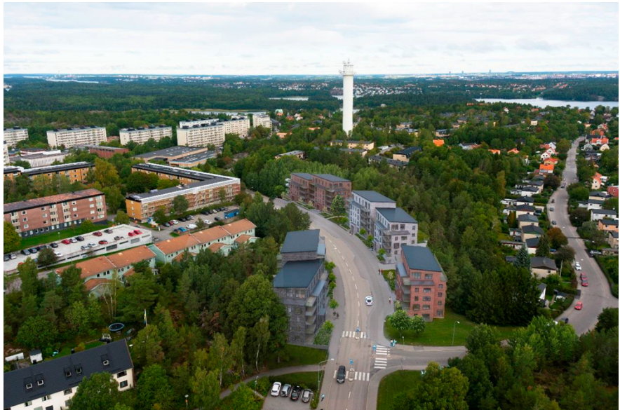
Den nya bebyggelsen längs Bredängsvägen sett från söder. Illustration ÅWL arkitekter.

Förslaget består av fyra lamellhus om fem våningar. Bebyggelsen förstärker platsens topografi och gatans lutning genom trappningar, placering och uppbrutna byggnadsvolymer. Mellan byggnaderna släpps naturen fram mellan husen.