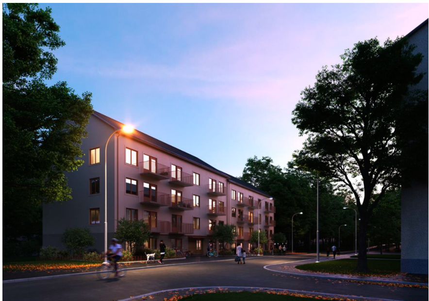
Visionsbild, norra husen. Genom uttryck och placering förstärker den nya bebyggelsen gaturummet på platsen. Huset föreslås uppföras i 4 våningar. Bild: Nyréns arkitektkontor

Den södra bebyggelsen, närmast Södertäljevägen E4/E20, placeras parallellt med vägen, som närmast cirka 40 meter mellan huskropp och Södertäljevägen. Fyra respektive fem lameller är sammanfogade med livförskjutningar som skapar nischer mot gata och gård. Husen byggs i fyra till sex våningar och har entréer från både gård och gata. I anslutning till gårdsentréerna ordnas uteplatser, cykelparkeringar och viss dagvattenhantering.