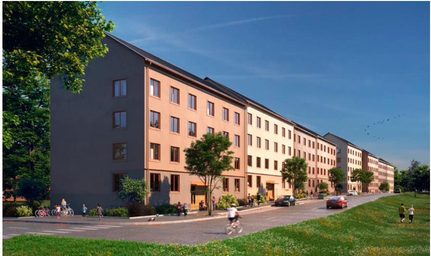
Visionsbild av de södra husen (A – J) sett från sydväst. Husen är utformade enligt riktlinjer för Stockholmshus. Bild: Nyréns Arkitektkontor

Den södra bebyggelsen, närmast Södertäljevägen E4/E20, placeras parallellt med vägen, som närmast cirka 40 meter mellan huskropp och Södertäljevägen. Fyra respektive fem lameller är sammanfogade med livförskjutningar som skapar nischer mot gata och gård. Husen byggs i fyra till sex våningar och har entréer från både gård och gata. I anslutning till gårdsentréerna ordnas uteplatser, cykelparkeringar och viss dagvattenhantering.