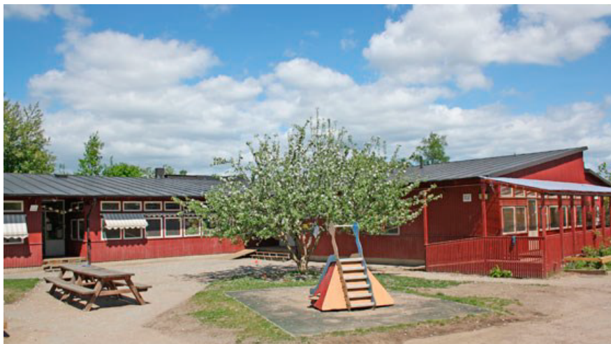
Befintlig förskolebyggnad inom fastigheten Baretten 2.