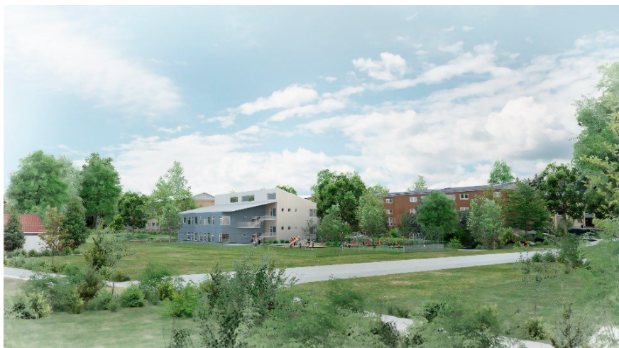
Vy från förskolegården. Illustration: Max Arkitekter

av kostsamma sprängningsarbeten minskas då den delen av tomten är kuperad. Byggnaden smälter in i den omgivande bebyggelsen genom sin storlek och sina proportioner. Fasaden som vetter mot Hanna Rydhs Gata föreslås bestå av ljust tegel och fasaden mot förskolegården av fasadskivor i en mörkare nyans för att knyta an till omgivningen.