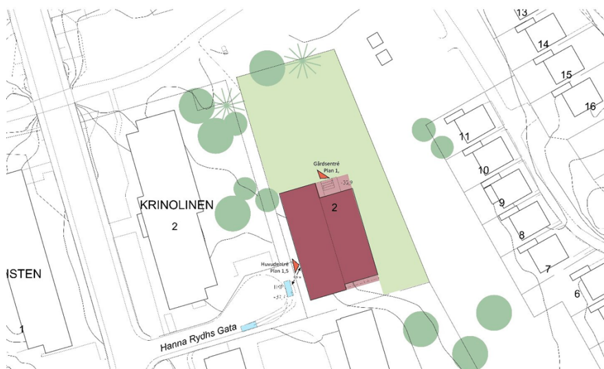
Situationsplan över planområdet som visar byggnadens placering. Illustration: Max Arkitekter

Detaljplanen möjliggör en friliggande förskolebyggnad i tre våningar, varav en är suterrängvåning, med teknisk kapacitet att inrymma en förskoleverksamhet med åtta avdelningar med upp till 18 barn/avdelning.