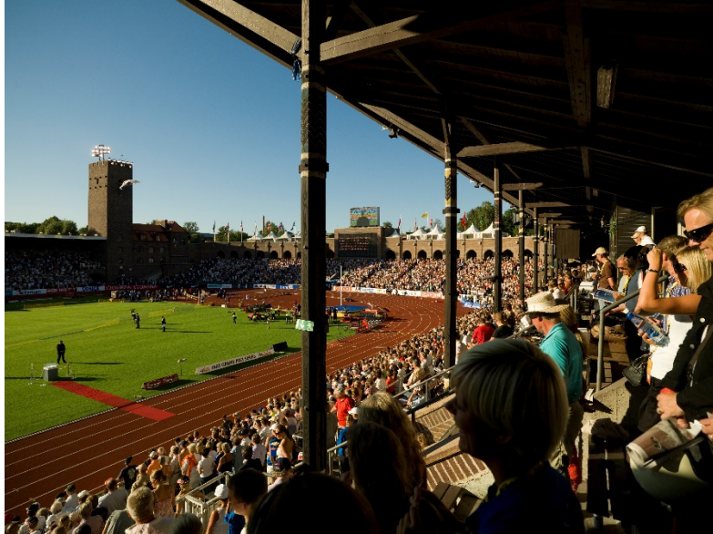
Figur 3 – Stadion Arena

i flertalet kulörer 5 . Konstgräset har ofta fyllnadsmaterial av sand eller gummigranulat 6 . I Stockholms stad ska sand användas som ifyllnadsmaterial i konstgräs på skolgårdar i stadens regi 7 . På Södermalm testas kokos/kork på ett par aktivitetsytor.