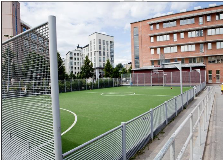
Figur 4 - Multisportarena skolgård