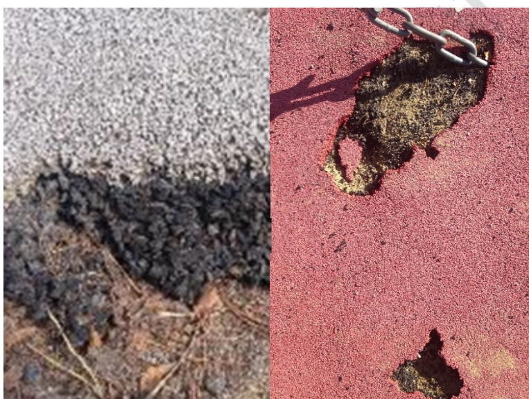
Figur 7 - Platsgjutet gummi med fallskydd på lekplats. Grått och rött topplager av EPDM, svart baslager av SBR, återvunna bildäck