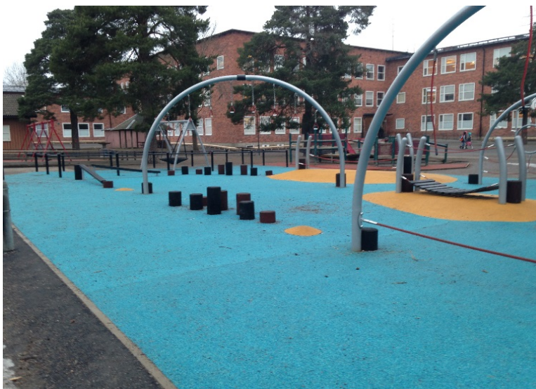
Figur 6 - Platsgjutet gummi på skolgård