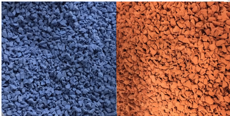
Figur 5 - Topplager platsgjuts av EPDM

Platsgjutet gummi består som regel av EPDM i varierande färger och används på aktivitetsytor men också i formationer på skolgårdar, förskolor och lekplatser. Bindemedlet av isocyanater bildar polyuretan efter härdning. Ska gummibeläggningen fungera som fallskydd läggs ett topplager av EPDM, som kan varieras i ett stort antal färger. Ett stötdämpande baslager , som regel av svart SBR (återvunna däck), läggs. Det finns även fallskyddsplattor som är gjutna i fabrik och alternativ till SBR som baslager i fallskyddssystem 9 . Ett alternativ av polyeten finns på marknaden 10 , övriga alternativ är ännu inte tillgängliga men flertalet av stadens leverantörer har uppgett att de arbetar med produktutveckling.