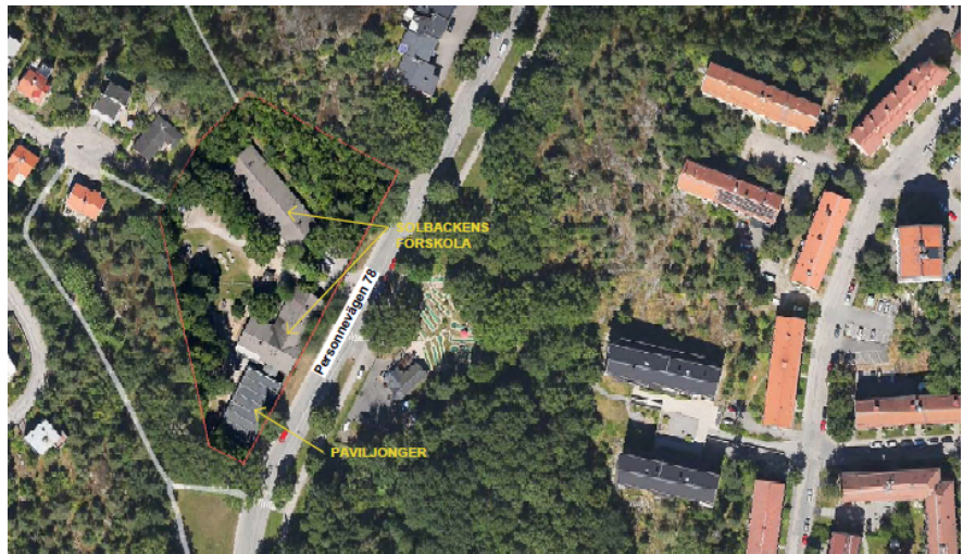
Ortofoto med beskrivning av paviljongernas läge samt permanenta byggnaders läge.

Fastigheten har en kuperad tomt på 6 975 kvadratmeter, vilket gör den till stadsdelsområdets största förskoletomt. Skolfastigheter i Stockholm AB (SISAB) har tomträtt på fastigheten och äger byggnaderna. Markytan rymmer enligt stadsdelsförvaltningens bedömning fler barngrupper än dagens åtta avdelningar.