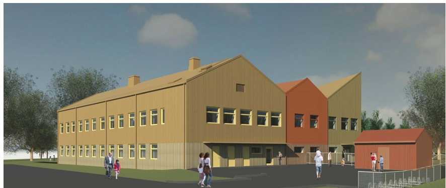
Vy från norr och gatan med angöring och personalentré.

Byggnaden uppförs i åldersbeständiga material och är väl anpassad efter övrig byggnation i området. Byggnaden har anpassats utifrån gällande detaljplan, som medger en byggnadshöjd på högst 8 meter. Byggnadens placering har anpassats efter ett ledningsstråk som skär rakt genom fastigheten från Personnevägen till Signe Hebbes väg.