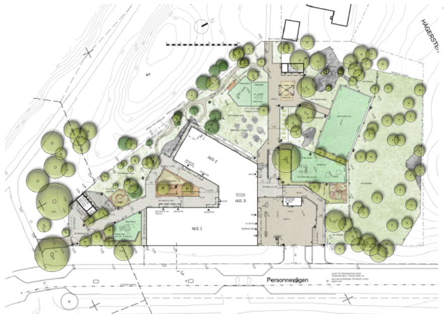
Situationsplan som visar byggnadens placering samt barnens planerade utemiljö.