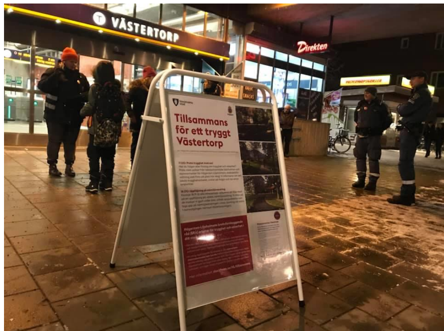
Dialogmöte med syfte att återkoppla närmiljövandringen som resulterade i trygghetsinvesteringen.