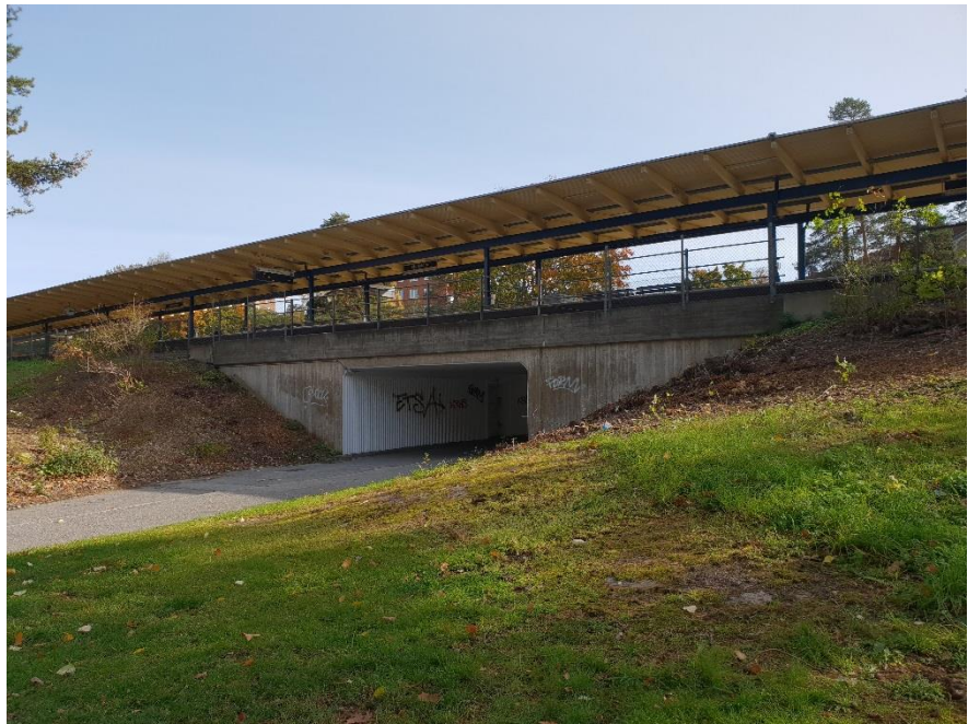
Gångtunnel som trafikkontoret rustade upp med målning och ny belysning i samband, ej bekostat av projektet. Slyröjning som stadsdelsförvaltningen egenfinansierade.