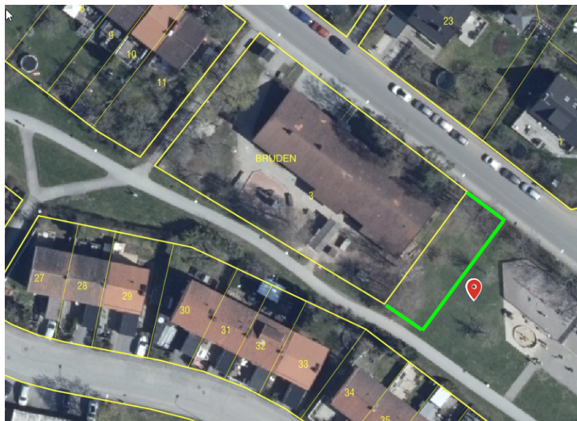
Bild 1: Förslag till utökning av förskolegården markerad med grön linje.

I medborgarförslaget framhålls att gården är till stor glädje för barnen på förskolan och att den används så flitigt att stora delar av gräsytorna slits ner till jorden när hösten närmar sig. För att gräset ska få återhämta sig har avspärningar på delar av gården förekommit.