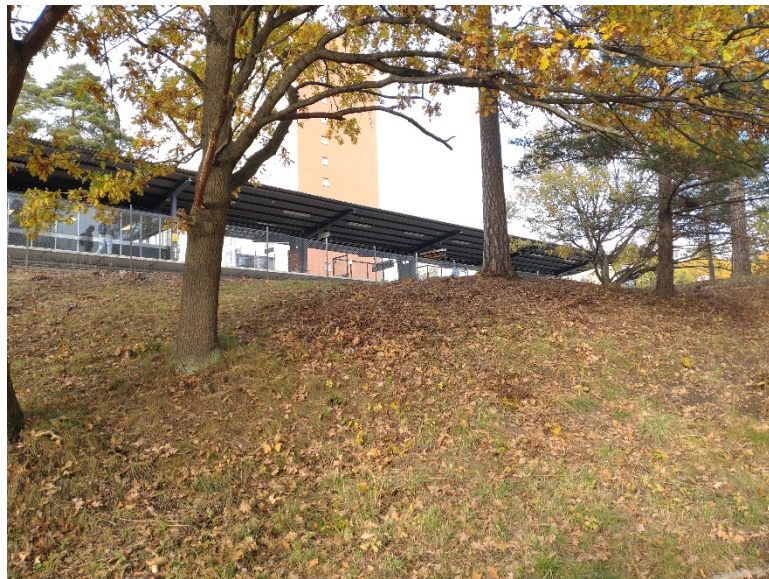
Tunnelbanekullen från Hässelby torg 2

Infoga bilder från plats efter trygghetsinvestering.