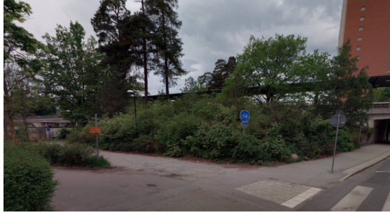
Tunnelbanekullen från Astrakangatan

Infoga om bilder finns från plats innan trygghetsinvestering.