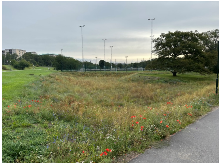
Del av fördröjningsdamm med ängsplantering, bevarad ek till höger i bilden.

11-spelsplanerna har fått granulutfällor och i södra delen av idrottsplatsen är ett så kallat svackdike för 100-årsregn gjort. Runt 7-spelplanen är en fördröjningsdamm för dagvatten utförd för exploateringskontorets räkning. Denna har i samråd med stadsdelsförvaltningen fått en ängsplantering, vilket kommer att bidra till den biologiska mångfalden. För att undvika ljusbuller mot de intilliggande radhusen har belysningen för 7-spelsplanen utförts med en tryckknapp och timer, så att belysningen endast sätts på vid spel.