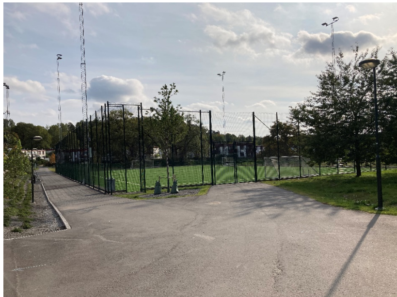
7-spelsplanen med intilliggande bostäder och pilträd i bakgrunden.

Dessa förändringar gjort att anpassningen till platsen är bättre, att träd har kunnat sparas samt att ytterligare besparingar har kunnat göras utan att själva funktionen av en 7-spelsplan och fördröjningsdamm har ändrats.