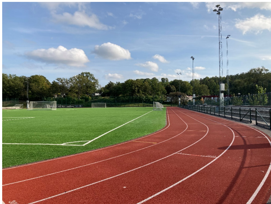
11-spelsplan med rundbana.

I en sista etapp tre har projektet anlagt en 7-spelsplan i konstgräs med staket, belysning, växtlighet, grindar och körytor. För exploateringskontorets räkning har projektet under denna etapp också utfört förändrad samt ny gång- och cykelbana samt fördröjningsdamm för dagvatten med ängsplantering.