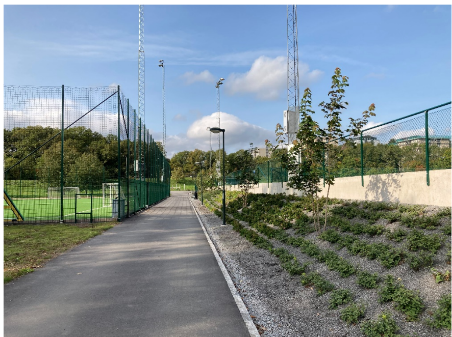
Ny gång- och cykelväg mellan 7-spelsplan och övriga idrottsområdet.