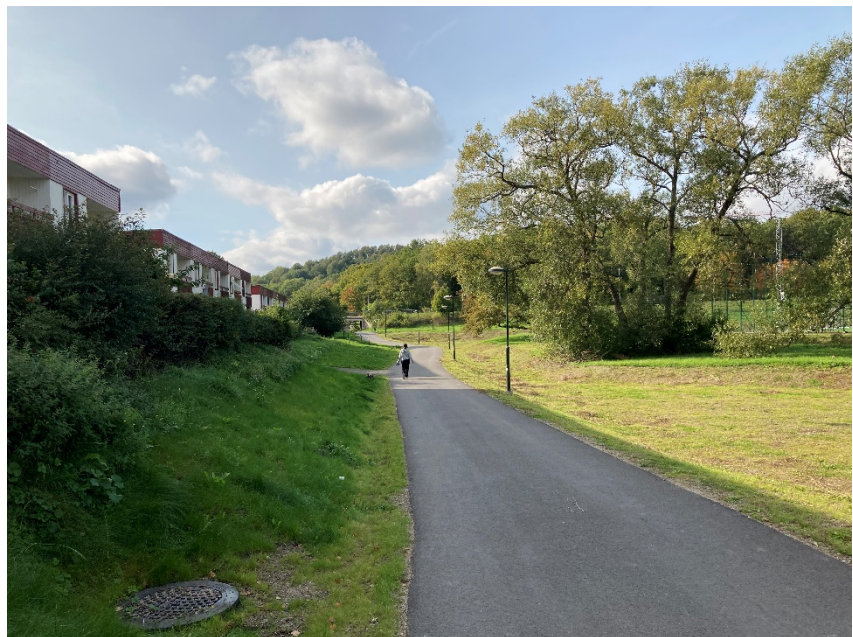
Bibehållna pilträäd, bakom dessa 7-spelsplanen.

Projektet har utförts i samarbete med idrottsförvaltningen, stadsbyggnadskontoret, stadsdelsförvaltningen, trafikkontoret och exploateringskontoret.