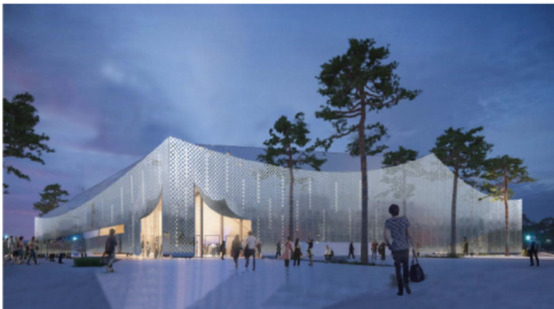
Visionsbild föreställande planerad ny ishall på Malarhöjdens IP. Illustration: MAF Arkitektkontor