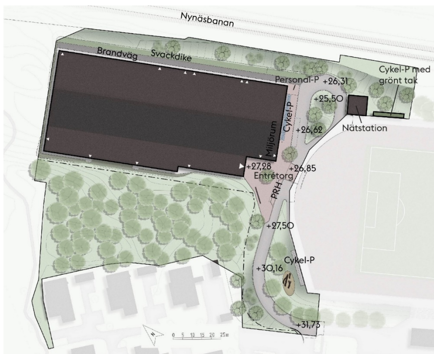
Illustrationsplan för Hagsätra is- och idrottshall (illustration framtagen av Cedervalls arkitekter).

Belysning och gallring av sly görs runt byggnaden för att skapa en trygg miljö. Byggnadens sydvästra del byggs i souterräng, på så vis anpassas volymen till platsens förutsättningar och delar av vegetation och berg i dagen bevaras. Marken kring byggnaden hanteras så att det inte ska vara möjligt att klättra upp på taket.