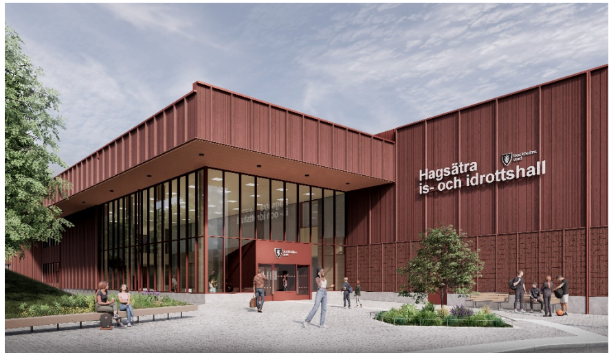
Illustrationer av Hagsätra is- och idrottshall (framtagna av Cedervalls arkitekter)

Domarrum samt omklädningsrum till ishallen förses med golv som är lämpligt för skridskor. Spelare och aktiva når ishallen från omklädningsrum via kommunikationsytor. Två entréer för aktiva skapas till ishallen för att säkerställa trygga flöden för hemma- och bortalag. När ishallen är öppen för allmänhetens åkning sker entré från den centrala uppehållsytan. Till ishallen skapas tio föreningsförråd, sliprum, sjukvårdsrum och föreningstvättstuga.