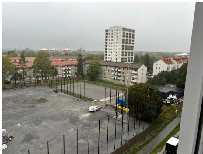
Översiktsbild över den östra delen av bollplanen med multisportytan i bakgrunden. Till höger syns servicebyggnaden och kylsystemets gaskylare.

Produktionen påbörjades vintern 2024. Ett första spadtag anordnades i februari 2024. Sedan dess har produktionen pågått enligt tidplanen för nybyggnationen.