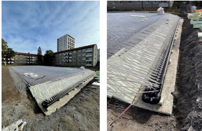
Multisportytan med ispisten under produktion. På bilderna syns det underliggande köldbärarsystemet för ispisten.