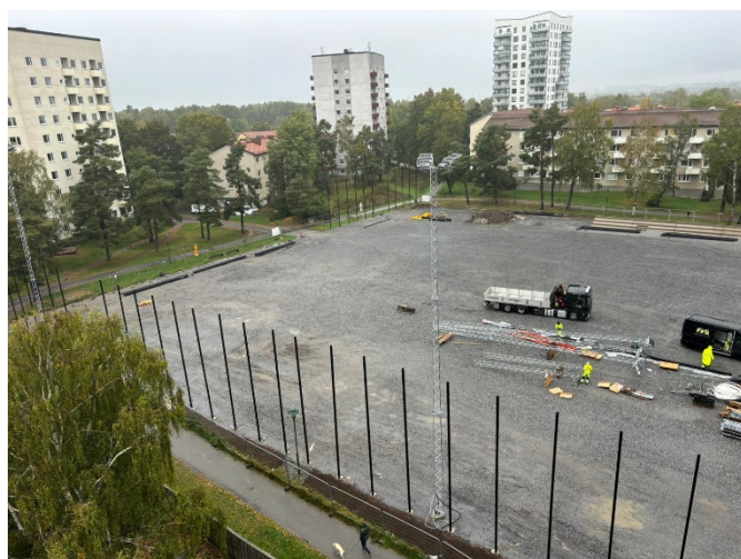
Översiktsbild över den västra delen av bollplanen. I förgrunden syns stängselstolpar och en belysningsmast. I bakgrunden syns läktaren.