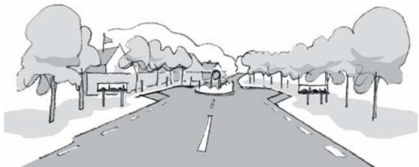
Bild 11: Avsmalning med port

Port är en fartdämpande åtgärd som är lämplig vid entrén till en tätort eller ett område i en tätort. Avsmalningen och fartdämpningen kan utformas som en förskjutning, gupp, cirkulationsplats eller förträngning. Fartdämpningen kan även utformas med planteringar, beläggning, portaler mm.