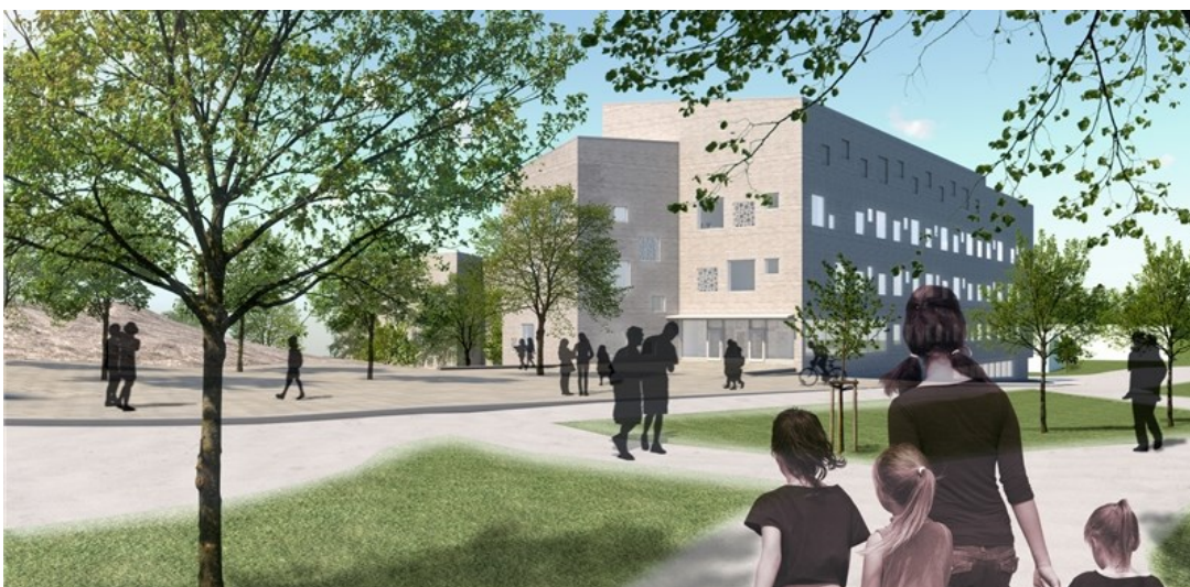
Illustration mot nya hus H. Bildkälla Cedervall arkitekter