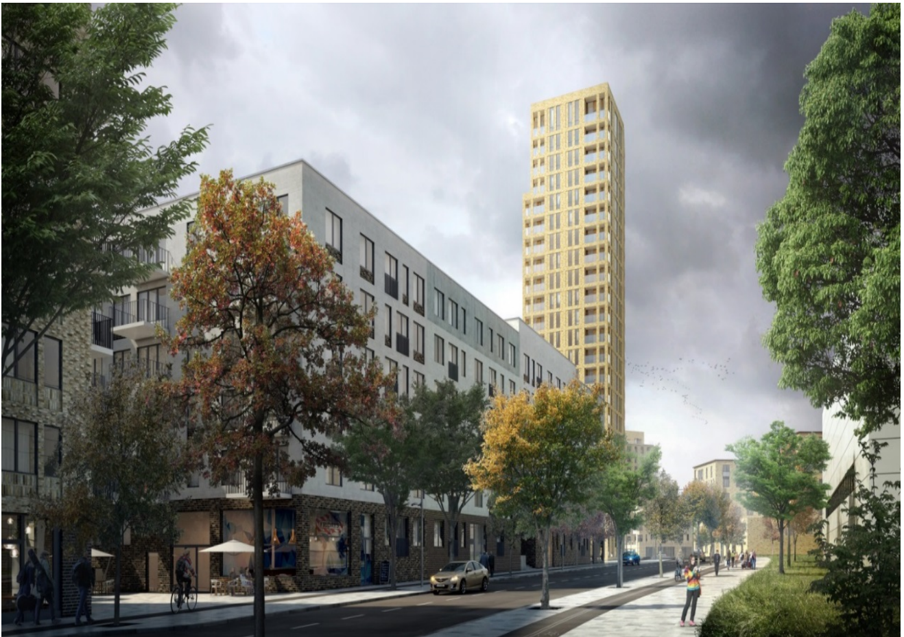
Visionsbild: Kabelverket 17 med ett punkthus på 20 våningar (lamellhusen syns ej) i förgrunden färdigställda Kabelverket 9 (DP1)