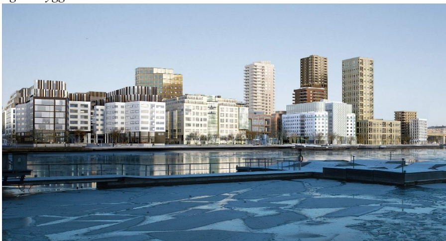
Vy från Sjövikskajen (illustration Sightline). Byggnadernas gestaltning fastställs slutligen i bygglovsskedet.

Bebyggelsen är idag väl synlig mot Årstaviken. Den nya bebyggelsen, främst i planområdets norra del, innebär en skalförskjutning i förhållande till omgivningen och en förändring av stadsbild och siluett. Den höga tätheten ställer krav på de offentliga rummens och de nya byggnadernas arkitektoniska kvalitet samt att de bidrar positivt både på nära och långt håll. Hög arkitektonisk kvalitet avser hela byggnadens gestaltning, att bebyggelsen är identitetsskapande, bidrar till orienterbarhet, levande gaturum och en god boende-, arbets- och besöksmiljö. Gestaltungsprinciper har tagits fram som ska beaktas vid ny-, om- och tillbyggnad för att uppnå planens syfte: