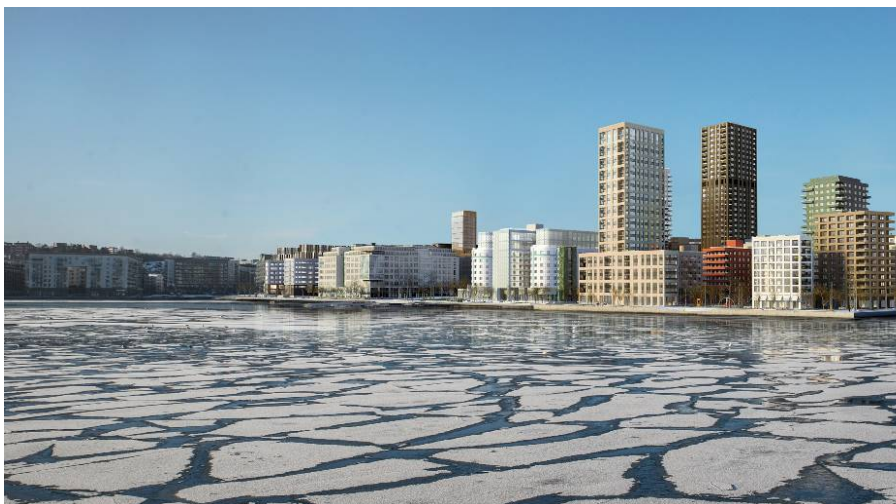
Vy från Tantolunden (illustration Sightline). Byggnadernas gestaltning fastställs slutligen i bygglovsskedet.