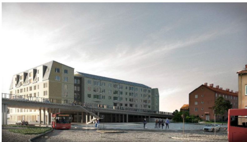
Möjlig utformning av kvarteret, vy från Spånga bussterminal. (Brunnberg & Forshed)

Kvarteret dockas mot viadukten och ger möjlighet till entréer både från viadukten och från utrymmet under viadukten. Krav på genomsiktlighet i fasad mot utrymmet under viadukten ställs i detaljplanen i syfte att öka graden av trygghet på platsen.