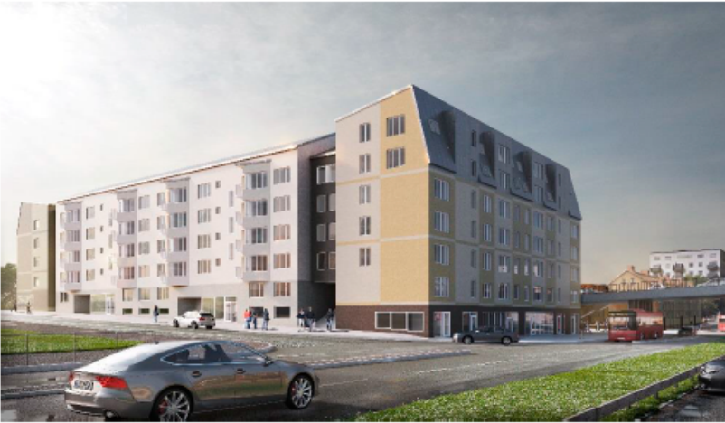
Möjlig utformning av kvarteret, vy från Bromstensvägen. (Brunnberg & Forshed)