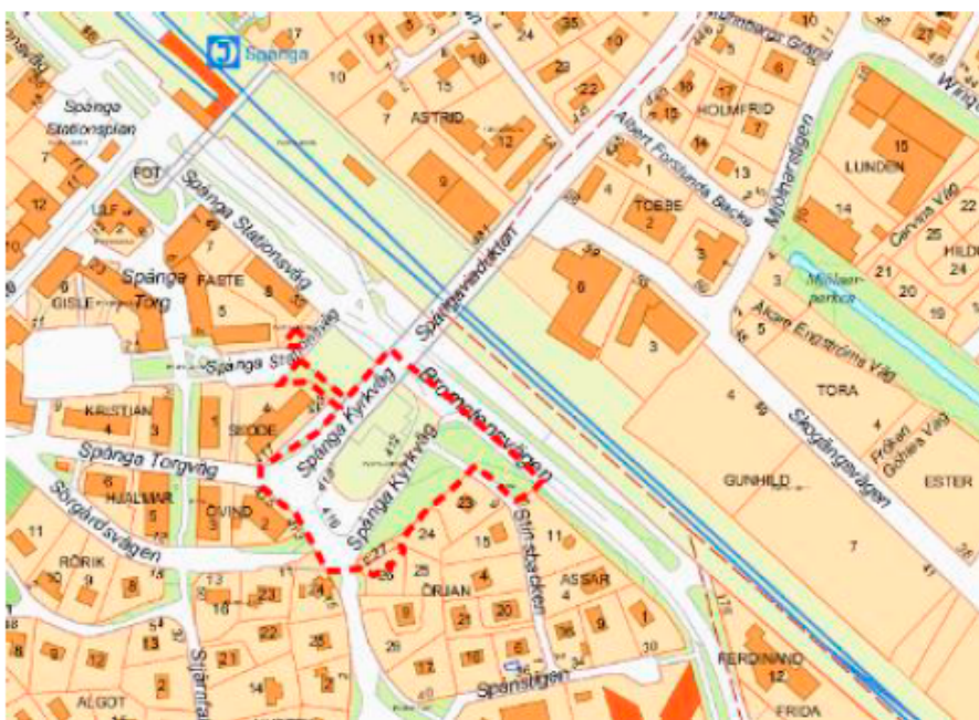
Karta som visar planområdets avgränsning.