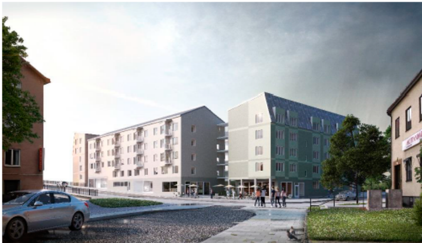
Möjlig platsbildning i fonden av Spånga Torgväg. (Brunnberg & Forshed)

Kvarteret dockas mot viadukten och ger möjlighet till entréer både från viadukten och från utrymmet under viadukten. Krav på genomsiktlighet i fasad mot utrymmet under viadukten ställs i detaljplanen i syfte att öka graden av trygghet på platsen.