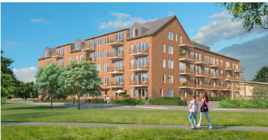
Den nya byggnaden sedd ifrån Bäckimjegränd i sydöst. Illustration: ÅWL Arkitekter