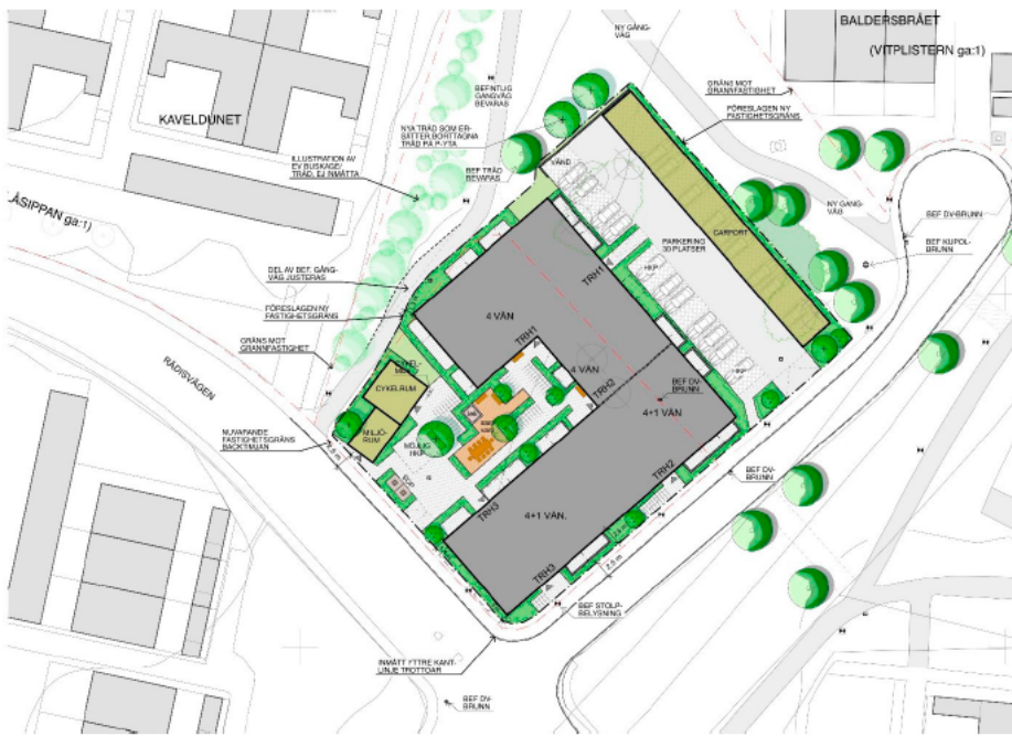
Illustrationsplan av ÅWL Arkitekter.