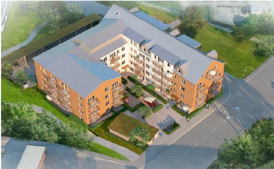
Vy över byggnaden från väster. Illustration: AWL Arkitekter.