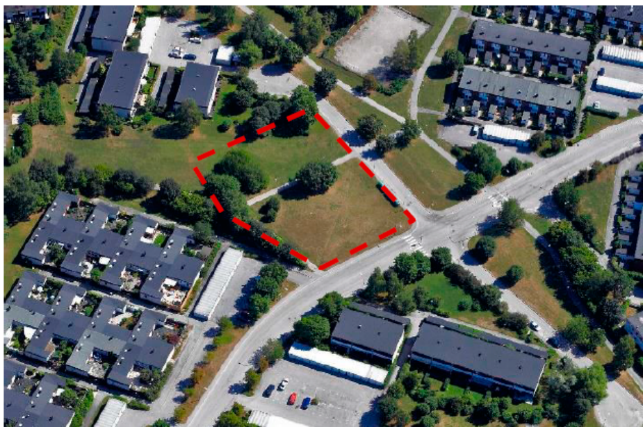
Planområdet markerat med röd, streckad linje.